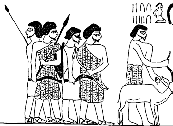
Picha hii ilipatikana Misri ndani ya kaburi mzee Watu wageni kama nduguze Yusufu wanazuru Misri.

Lakini hawangeenda Misri bila kuchukua Benyamini. Yakobo alifadhaika na kuhuzunika. Alisema kwamba atakufa ikiwa kitu chochote kitafanyika kwa Benyamini huko Misri. Yakobo aliomba Mungu awalinde na awarudishe salama nyumbani.